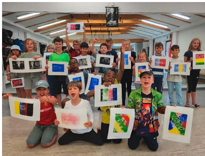
Begeistert zeigen die jungen Sportler ihre Kunst.