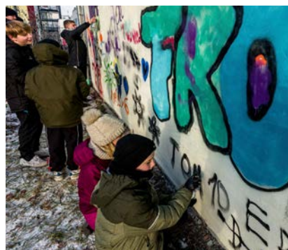
Der Graffiti Workshop mit Kindern und Jugendlichen im Dezember 2022, von der Partnerschaft für Demokratie Neubrandenburg gefördert, war der Auftakt für „Streetart in NB – 2023“

eine Initiative bei Bewohnern der Schwedenstraße aus, ihren Stadtteil in das Projekt einzubeziehen. Die Initiative wurde aufgegriffen und diese Bürger aktiv in die Verwirklichung des Projektes einbezogen..