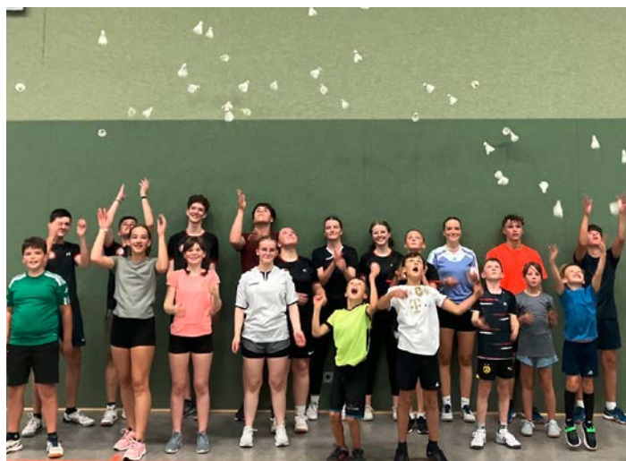
Die leichteren Naturfederbälle fliegen zu sehen - eine Freude für alle neugewonnenen Badmintonspielerinnen des Vereins.

Zu dem Anspruch, die kulturelle Infrastruktur attraktiver, Neubrandenburg als Zentrum der Mecklenburgischen Seenplatte mitzugestalten, konnte der Studio am See e.V. beitragen. Musiker, bildende Künstler hatten mit vielen Beteiligungsmöglichkeiten ein breites Publikum erreicht. Elektronacht, Kinderkonzert mit stationärem Musizieren waren ebenso Bestandteil wie die Indie- und Tanznacht. Mehr als 800 Besuchende erlebten das Festival mit Künstlern, die ihren Lebensmittelpunkt in Neubrandenburg haben.