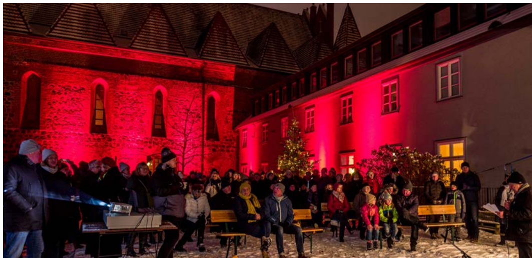
Gut besucht – das jährliche Weihnachtssingen.

Eigene Projekte – Jeden 1. Freitag im Dezember, 2024 am 6. Dezember