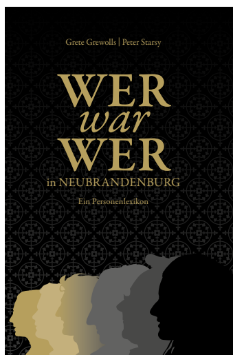
Das neue Lexikon ist im Regionalmuseum erhältlich.

In den Bereichen Bildung, Erziehung und Ausbildung, Kunst und Kultur sowie im Sport waren das jeweils drei Projekte. Das Projekt „Kunst trifft Karate“ war als übergreifendes Projekt erneut für eine Förderung vorgeschlagen worden. Die Übergabe der Stiftungsurkunden an Vertreter der Geförderten war von Mitgliedern des Vorstandes und Kuratoriums öffentlichkeitswirksam auf der Veranstaltung „Neubrandenburg picknickt – 2023“ am Brodaer Strand des Tollensesee vorgenommen worden. Das soll auch künftig so sein.