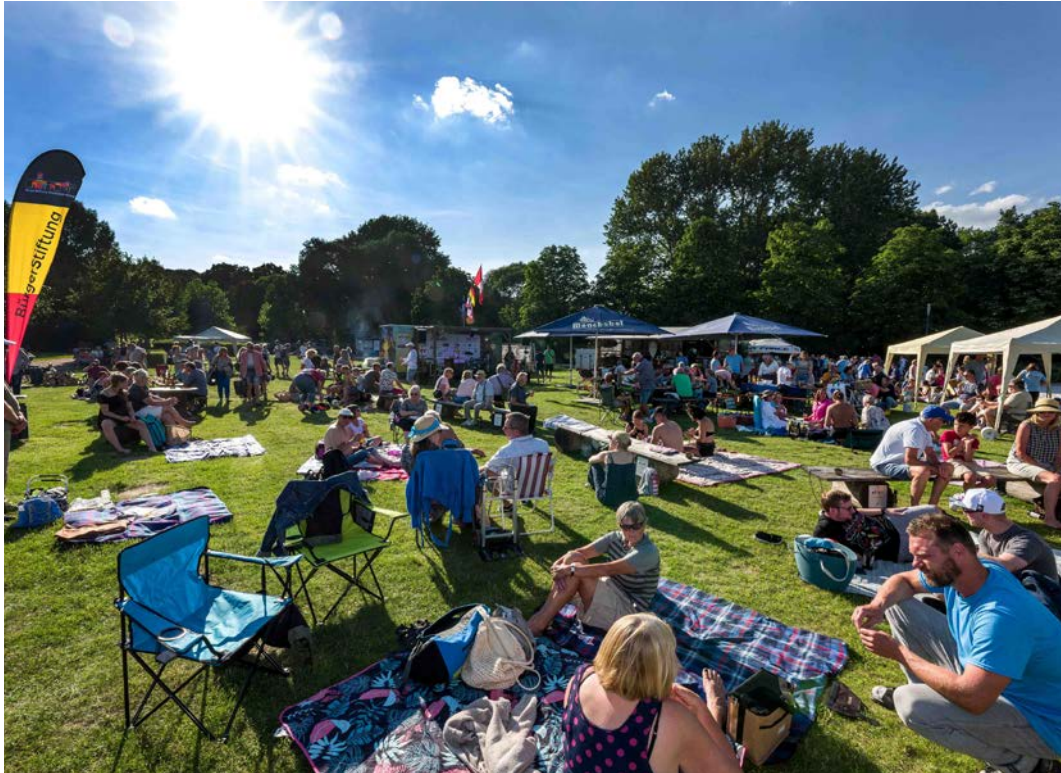
Picknicker, Tänzer, Sonnenanbeter oder fleißige Helfer, ob jung oder alt, ob mit Rollator, Volleyball, Badehose oder Sonnenbrille-zum diesjährigen 5. Bürgerpicknick waren viele gekommen.

Eigene Projekte – Auf Einladung der BürgerStiftung picknickten über 800 Neubrandenburger